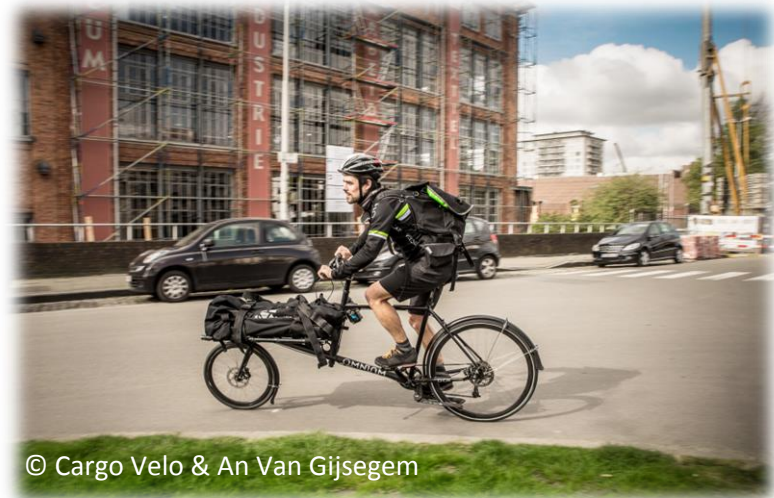
© Cargo Velo & An Van Gijsegem